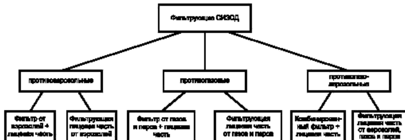
Рисунок 3 — Классификация фильтрующих средств индивидуальной защиты органов дыхания

Классификация фильтрующих СИЗОД представлена на рисунке 3.